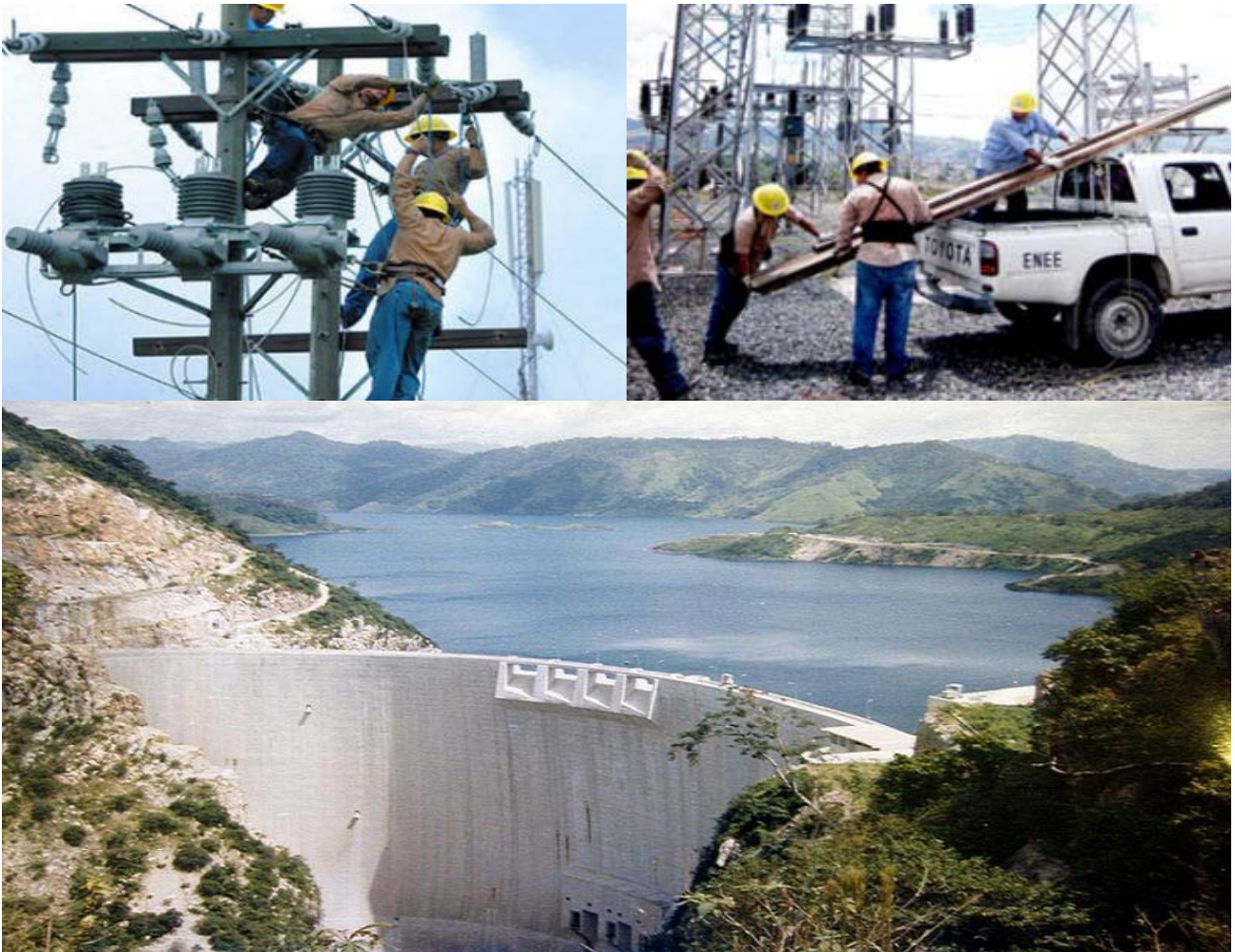
REPRESA CENTRAL HIDROELECTRICA FRANCISCO MORAZAN